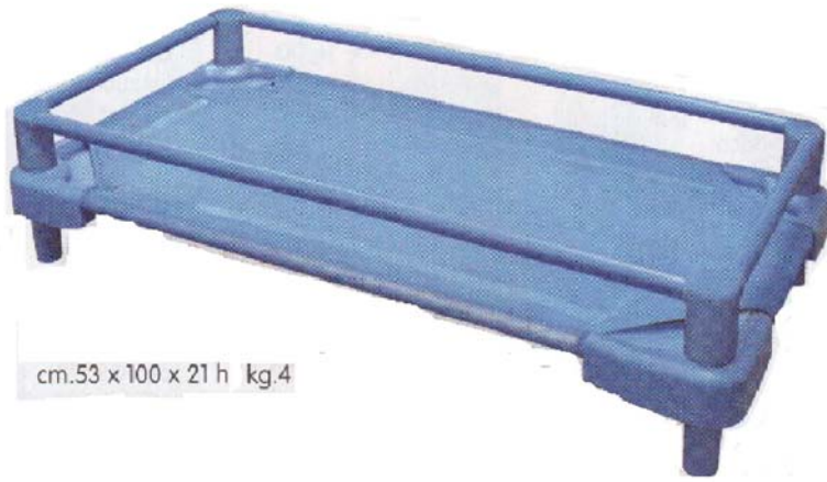
cm.53 x 100 x 21 h kg.4